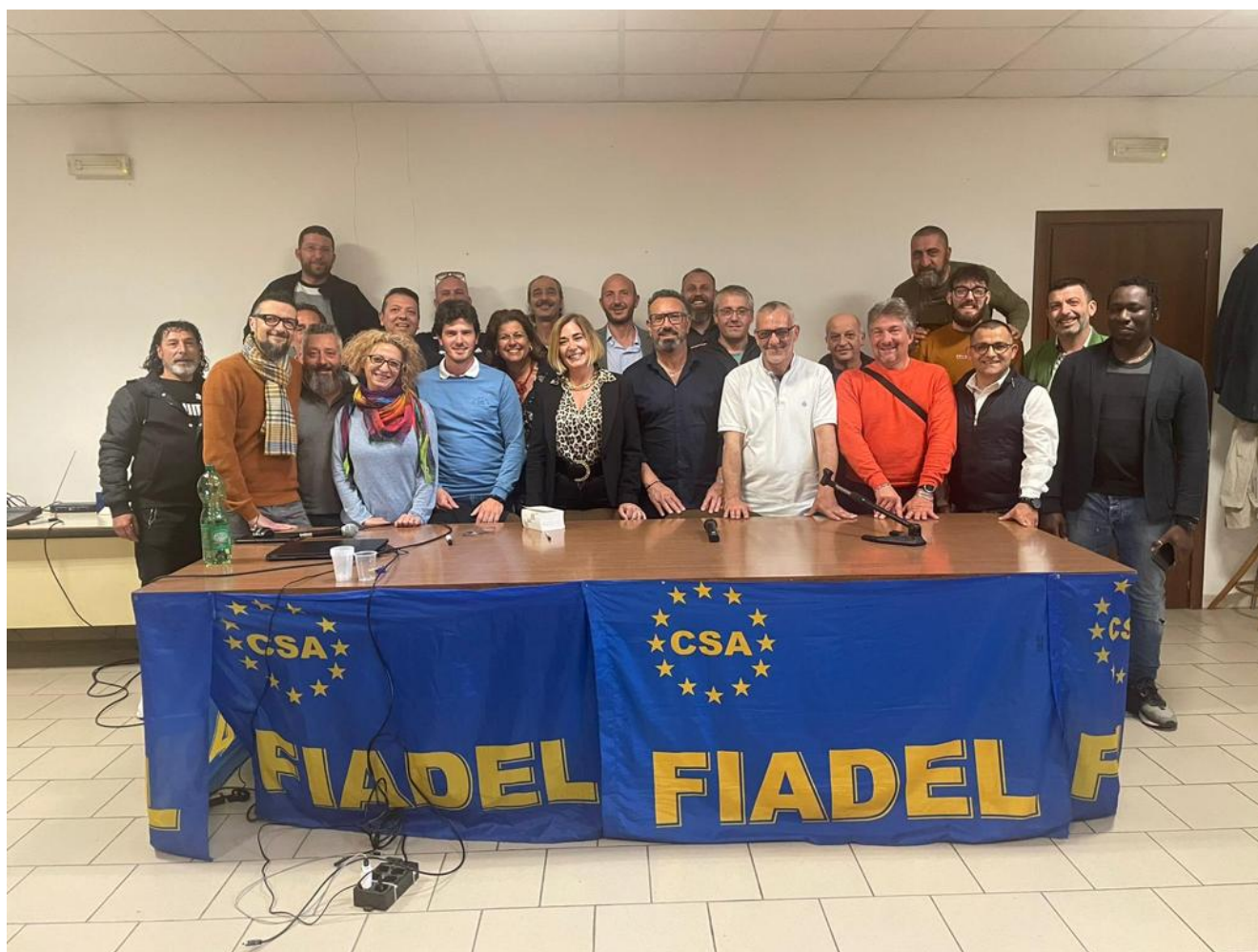
(Foto: Avv. Rossella Vitali ed i Dirigenti e Quadri FIADDEL partecipanti al corso di formazione sindacale)

I partecipanti hanno espresso grande apprezzamento per l'impeccabile organizzazione dell'evento che ha reso l'esperienza formativa estremamente proficua per i contenuti forniti. Senza dubbio, la prima sessione del Corso di Formazione è stata un'esperienza formativa senza precedenti e tutti i partecipanti hanno appreso grande soddisfazione e grande apprezzamento.