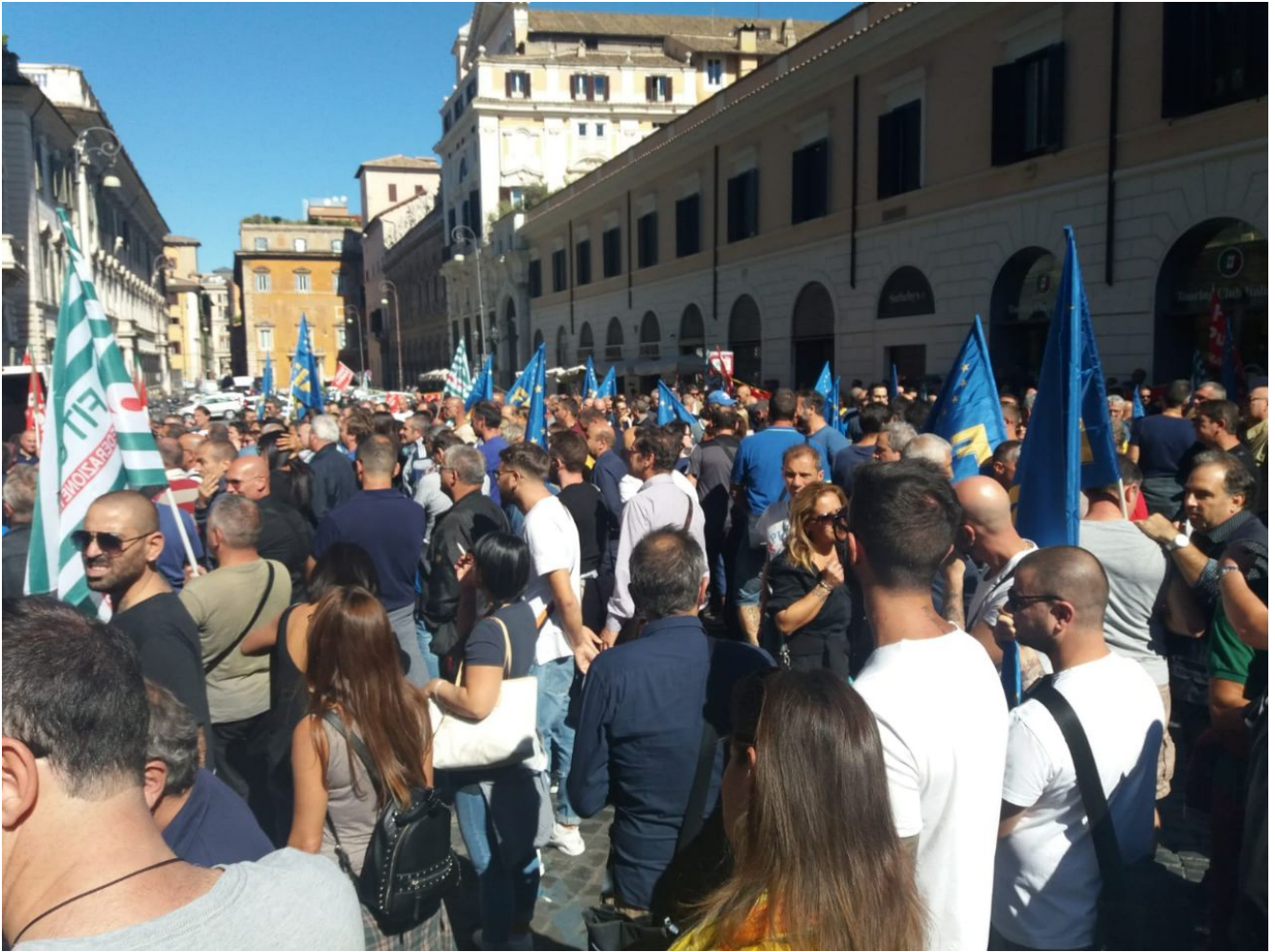
LAVORATRICI e LAVORATORI partecipanti all'assemblea cittadina