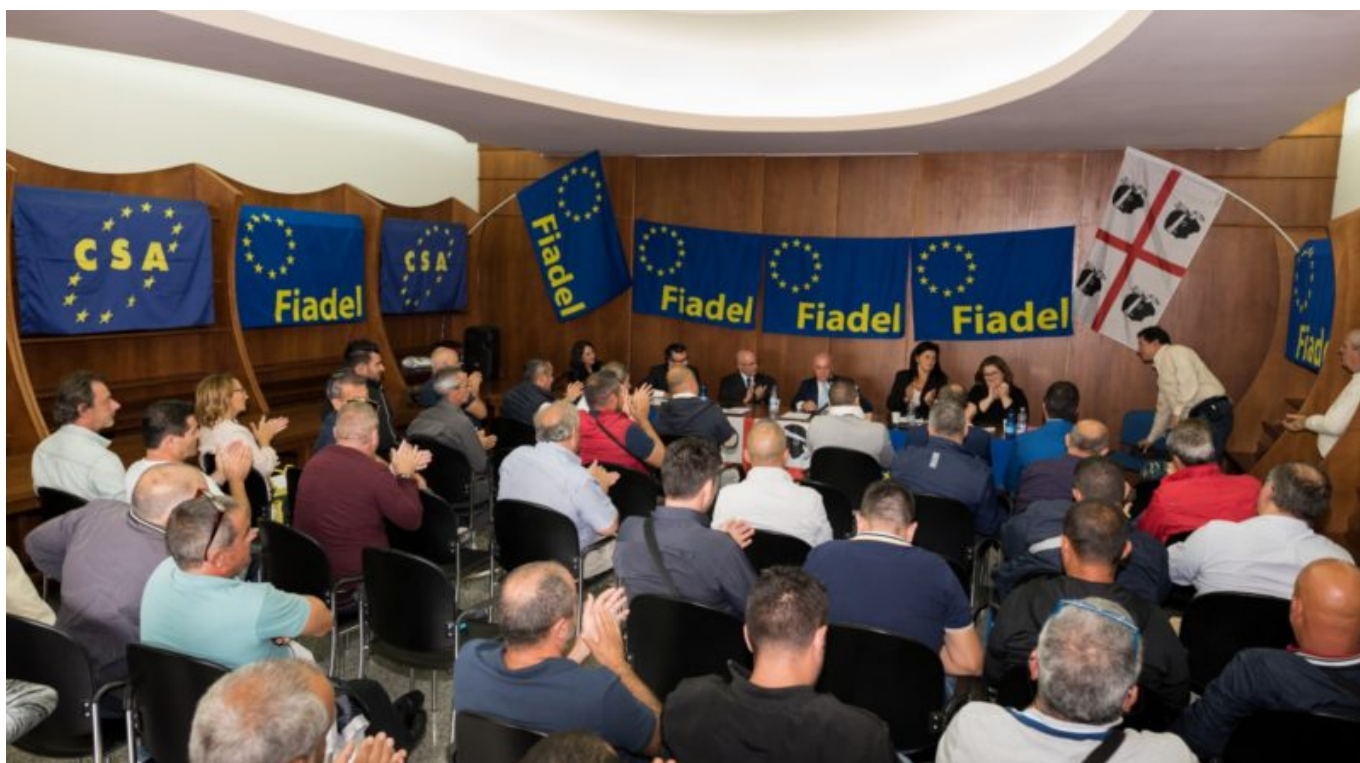
altre immagini dell'inaugurazione